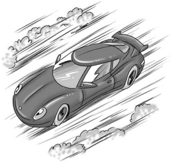
A fast car