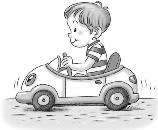
A slow car